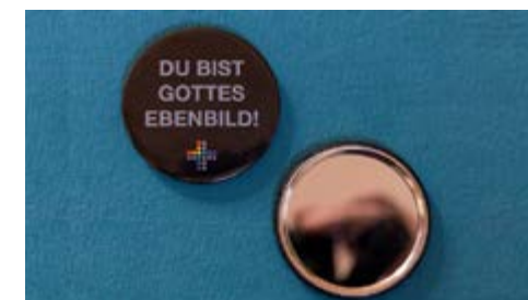
Spiegel für alle als Erinnerung

Der nächste GOTTESDIENST + findet am 12. April 2026 um 10:30 Uhr statt. Im Anschluss lädt das Team wieder zu einem Mittagessen ein.